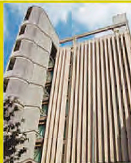
Dirección General de la ENP