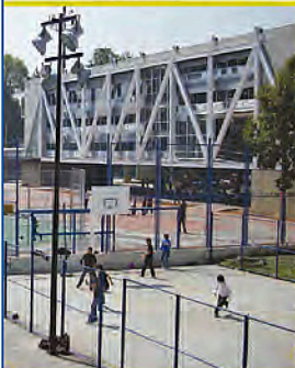
ENP 6 "Antonio Caso"

150 AÑOS ESCUELA NACIONAL PREPARATORIA 2 de diciembre de 1867 el Presidente Benito Juárez expide la "Ley Orgánica de Instrucción Pública en el Distrito Federal" mediante la cual se funda la ENP, iniciando su primer ciclo escolar el 3 de febrero de 1868.