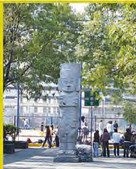
ENP 9 "Pedro de Alba"